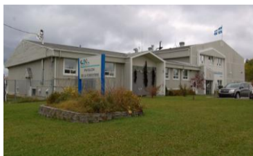
Pavillon de la Foresterie