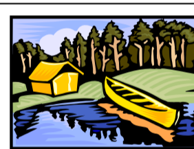
Protection et exploitation des territoires fauniques Gagnants d'une bourse de 700 $ au concours Entrepreneurship pour le projet Amélioration des chemins de la pourvoirie Beauchesne