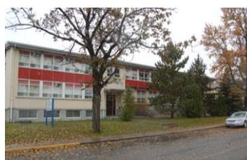
Pavillon de la Santé