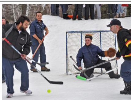
Activité de sports d'hiver au Camp Dudemaine