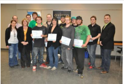
Finissants cohorte Mine Osisko en Conduite de machinerie lourde en voirie forestière