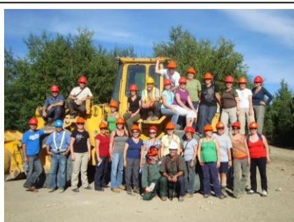
Camp des profs en formation professionnelle