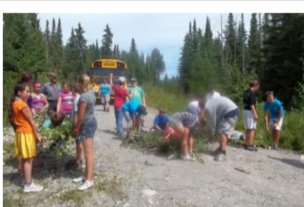
Camp des jeunes en formation professionnelle au Centre de formation Harricana