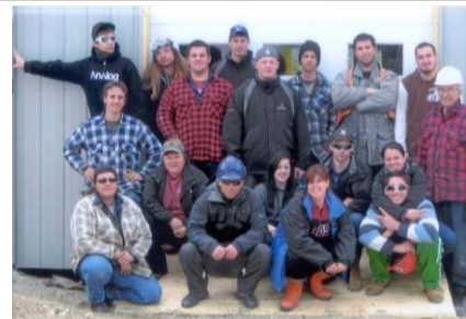
Construction d'un garage à la forêt école par le groupe de Protection et exploitation de territoires fauniques