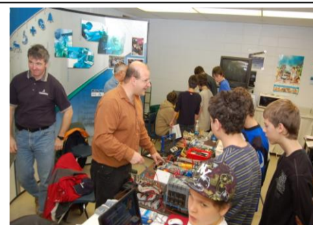
Journée Portes Ouvertes