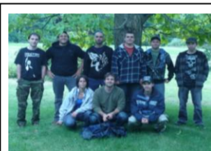
Aménagement de la forêt Gagnants d'une bourse de 750 $ au concours Entrepreneurship pour le projet Dégagement mécanique, élagage d'une plantation et entretien d'un sentier de la nature