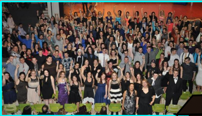
Graduation des élèves réguliers 271 élèves finissants