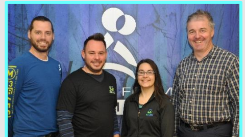
Collaboration avec le MRAR pour offrir des petits déjeuners aux élèves