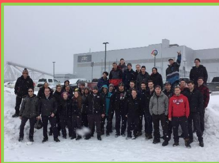
Visite à la mine Canadian Malartic pour les élèves de mécanique industrielle