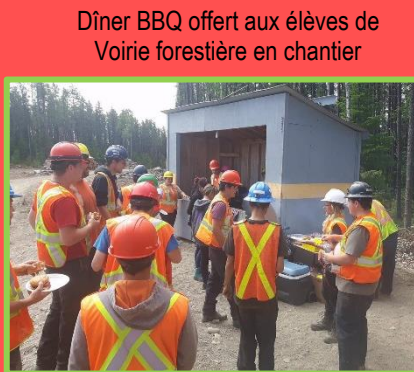
Dîner BBQ offert aux élèves de Voirie forestière en chantier