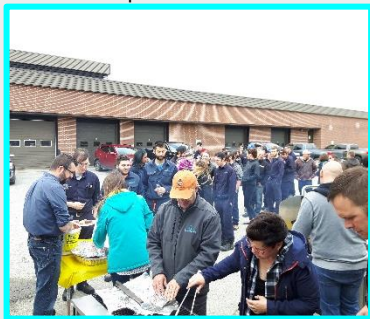
Dîner BBQ pour tous les élèves et le personnel du centre