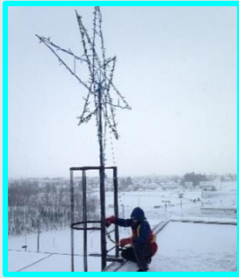
Étoile Culturat sur le toit de la polyvalente de la forêt