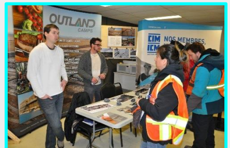
Activité dans le cadre de la Semaine minière organisée en collaboration avec l'Institut Canadien des mines, secteur Amos