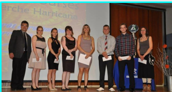
Bourses remises à un élève de chacun des groupes lors de la graduation des élèves réguliers par Forêt et Recherche Harricana