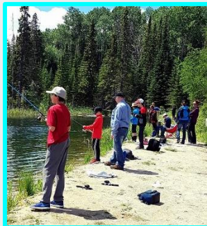
Activité de pêche pour les élèves de l'école Christ-Roi avec les enseignants de Protection et exploitation de territoires fauniques