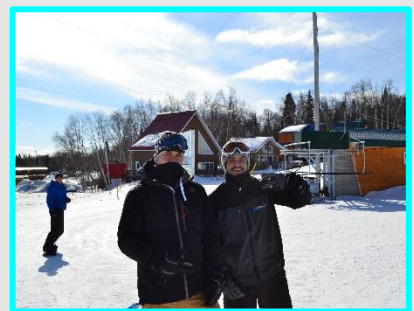
Activités au Mont-Vidéo pour tous les élèves du centre