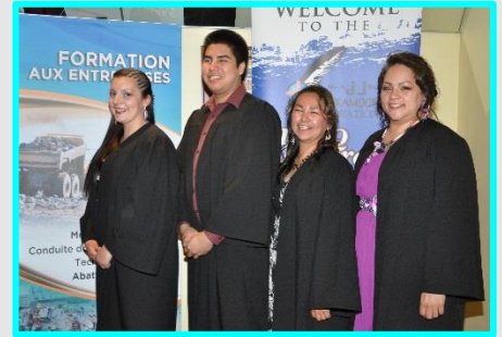
Graduation de la dernière cohorte Niskamoon en mécanique industrielle