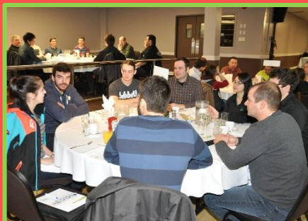
Déjeuner de la relève organisé par le MRAR