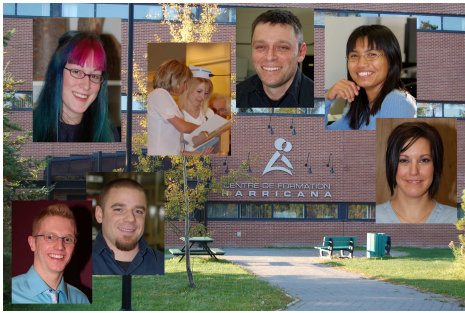
Mention de l'élève méritant de chaque groupe à tous les mois.