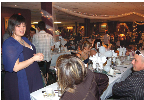
Soirée de graduation des élèves diplômées et diplômés