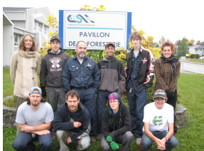
Gagnants du prix local du concours entrepreneurship Groupe « Aménagement de la forêt »