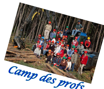
Camp des profs