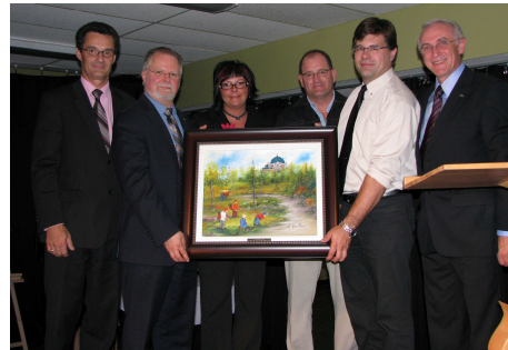
Gagnant du prix Michel Séguin pour « Le sentier de la nature »