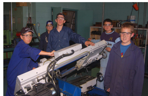
Camp des jeunes en formation professionnelle dans les secteurs de mécanique industrielle et techniques d'usinage.