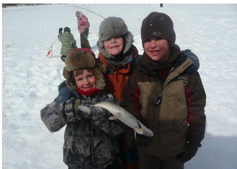
Activité de pêche blanche au lac Vassal organisée pour les élèves du primaire