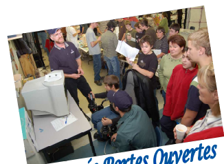
Journée Portes Ouvertes