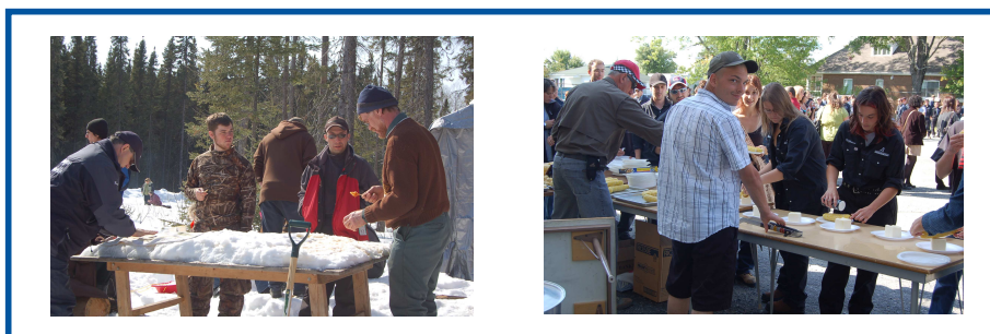
Activités « Cabane à sucre » et « Éphuchette de blés d'Inde » pour le personnel et les élèves