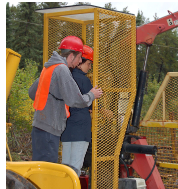
Présentation du projet « Confection d'une cage protectrice pour remorque forestière » au prix Innovation en santé et sécurité du travail