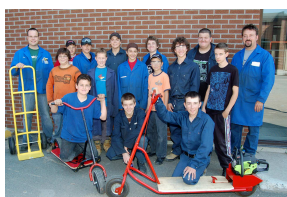
Camp des jeunes en formation professionnelle