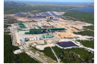
Formation en mécanique industrielle à la Mine Rio Tinto à Fort Dauphin Madagascar