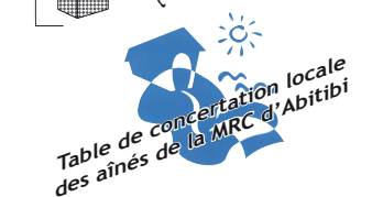
Table de concertation locale des aînés de la MRC d'Abitibi