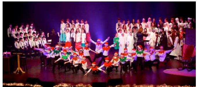
Groupes de concentration musique de Sacré-Coeur/Saint-Viateur

Ainsi, le mardi 16 décembre, vous pourrez entendre la comédie musicale loufoque, «Le Père Noël a perdu le Nord». Ensuite, l'harmonie des 5 e et 6 e années, la Chorale Saint-Viateur ainsi que l'ensemble vocal de Saint-Viateur vous offriront quelques beaux airs de Noël. Notez que les billets sont en vente à l'école Saint-Viateur au coût de 12 $ pour les adultes et de 5 $ pour les enfants de 12 ans et moins.